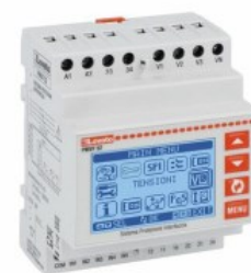
Sistema di protezione di interfaccia - Conforme norma CEI 0-21, bassa tensione (Italia) PMVF52