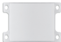
40171 - Kit pulsante monof. per targa 40170