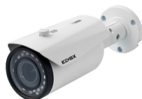
4651.2812B.1 - Tlc Bullet AHD 1080p ob. 2,8-12mm CVBS