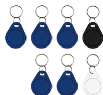
40169 - 7 Chiavette RFID Mifare