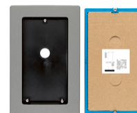
40179 - Kit accessori incasso targa 40170