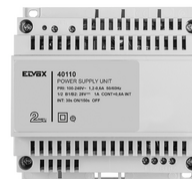
40110 - Alimentatore 2F+ 100-240V 1 OUT 1,6A