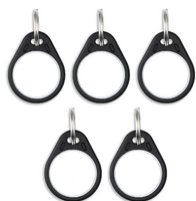
40175 - 5 Chiavette RFID MIFARE