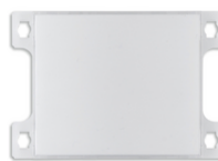
40171 - Kit pulsante monof. per targa 40170