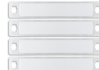
40174 - Kit 4 pulsanti singoli per targa 40170