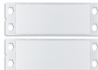
40172 - Kit 2 pulsanti doppi per targa 40170